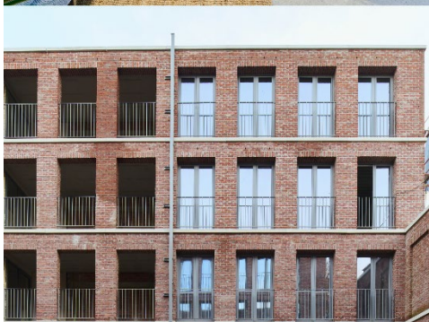
Den Dam – Anvers