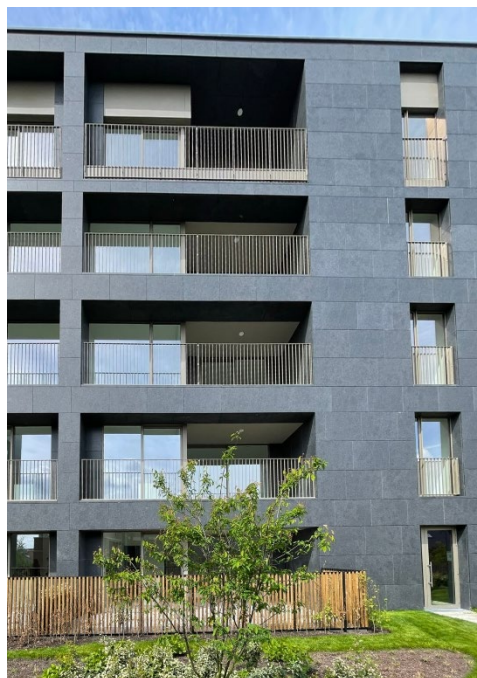
City Square – Hasselt