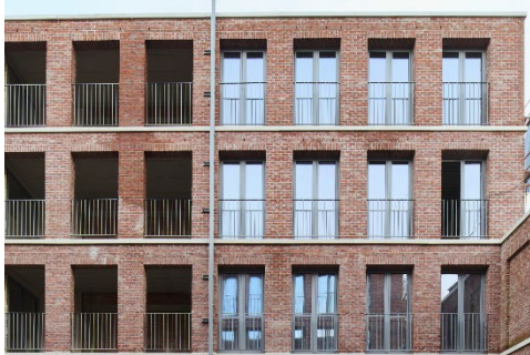
Den Dam – Antwerpen